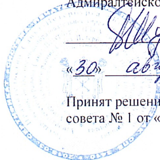
График проведения оценочных процедур в ГБОУ гимназии №278 имени Б.Б. Голицына Адмиралтейского района Санкт-Петербурга в первом полугодии 2023/2024 учебного года

Принят решением педагогического совета № 1 от «30» августа 2023 года