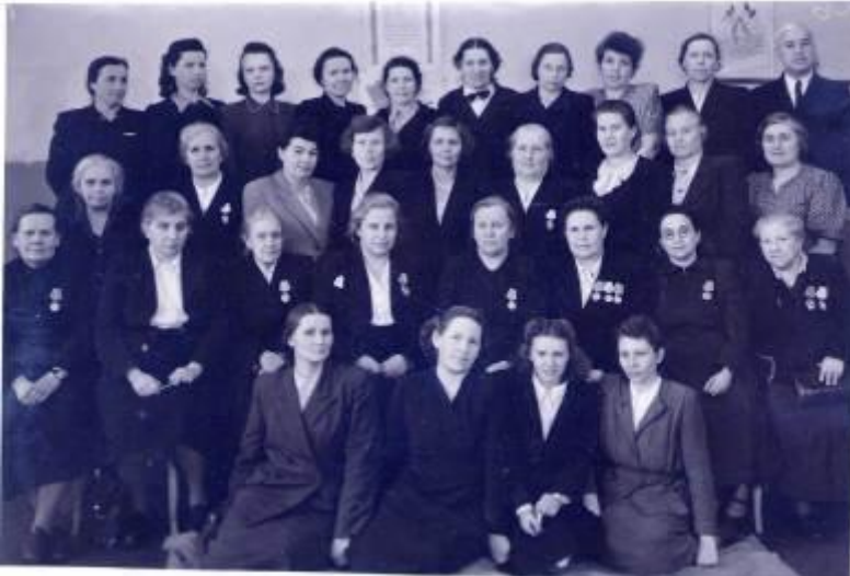
Педколлектив 1951-52 уч.г.