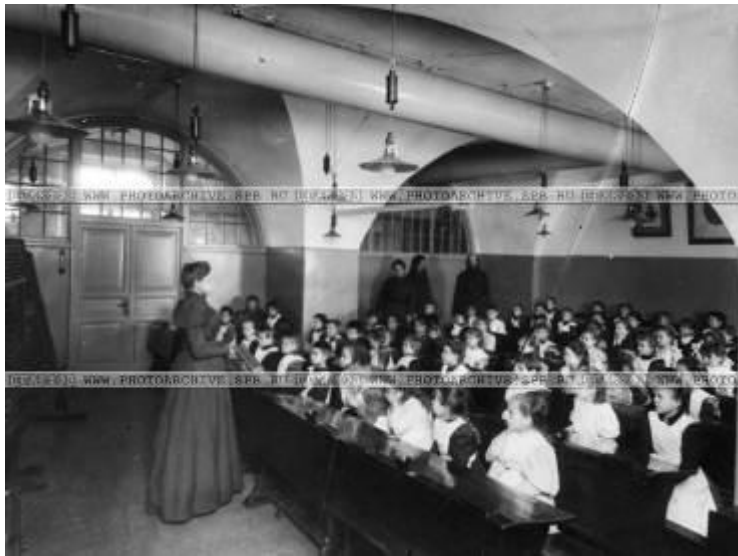
Занятия в классе девочек школы при Экспедиции заготовления государственных бумаг. 1903 год.