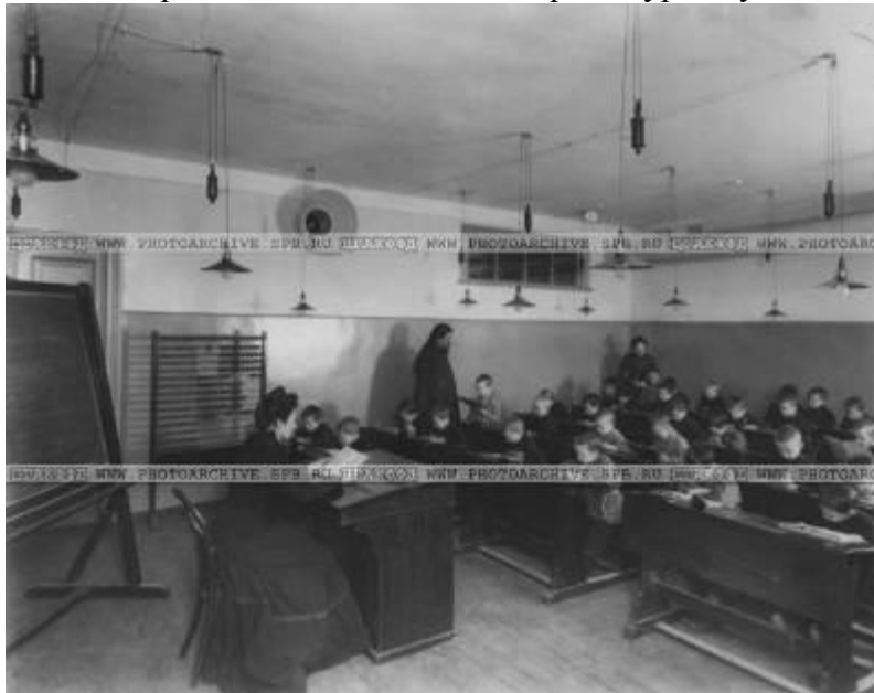
Урок чтения в классе мальчиков в начальной школе Экспедиции заготовления государственных бумаг (Рижский пр., д.3) 1913 год

ЭЗГБ при I-м (бумагоделательном) отделении была открыта школа бумажного дела (учебные мастерские) для детей служащих Экспедиции от 15 до 17 лет. Она имела своей целью подготовку подмастерьев и помощников мастеров. Курс обучения был трехгодичным.