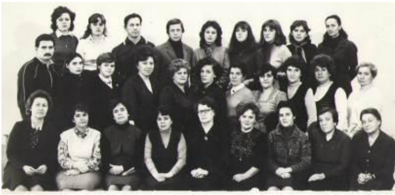
Педагогический коллектив 1984-85 уч.г.

В перестроечный период по личному распоряжению Горбачева начался безвалютный обмен делегациями с целью углубленного изучения языка с различными учебными заведениями Германии. Сначала со школой №5 немецкого города Цитау, затем были налажены тесные контакты с Валдеффер – гимназией города Гамбурга, школой имени Гумбольдта города Бад-Гомбурга, с гимназией ам Лертер города Зигена.