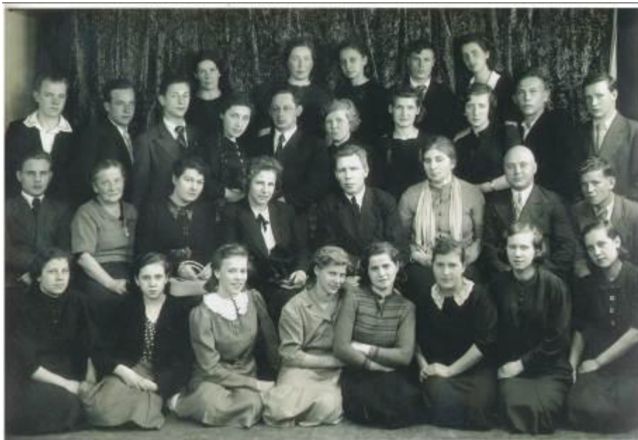
Выпускники школы №278. Фото 21 июня, 1941 года.