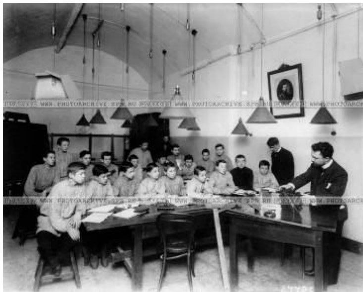
Занятия в классе мальчиков в школе при Экспедиции заготовления государственных бумаг., 1903 год (съемка)