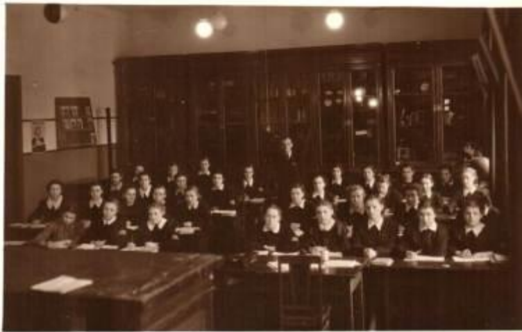
В кабинете физики