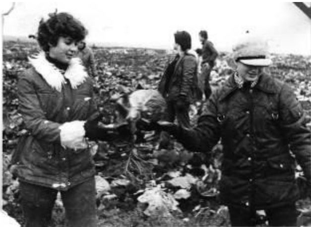
В совхозе Копорье