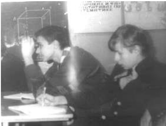
На уроке информатики Учащиеся шалили, как и сейчас