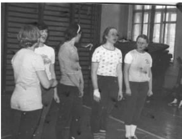
Урок физической культуры